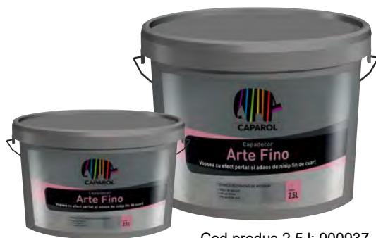
Cod produs 2,5 l: 900937 Cod produs 1,25 l: 900936